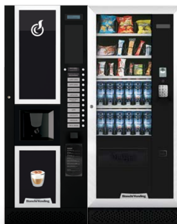
LEI400 + ARIA M MASTER

LEI400, distributore automatico per bevande calde con capacità di 400 bicchieri.