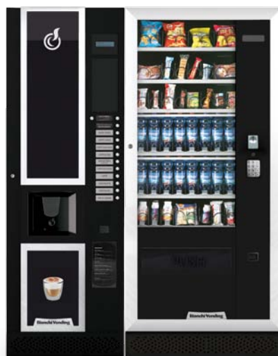
LEI600 + ARIA L MASTER

LEI600, distributore automatico per bevande calde con capacità di 600 bicchieri.