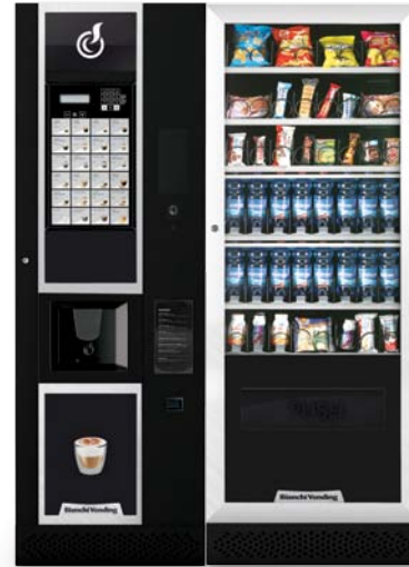
LEI600 SMART + ARIA L SLAVE